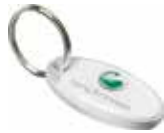
Ref. DT2154AG Llavero de Aluminio oval personalizado con doming. Medida: 44x22 mm. Colores: ○