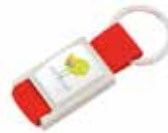
Ref. D14442MK Llavero metálico y cinta de Poliéster, personalizado con doming. Medida: 27x60x6 mm. Colores: ●●●●●●●●