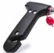
Ref. 5437 Martillo led de emergencia multifunción. Con linterna led de luz blanca, martillo rompecristales y cuchilla cortacinturones. Presentada en atractiva caja de diseño. Área máxima de impresión: 30 x 15 mm