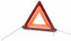
Ref. 5543 Triángulo plegable de emergencia homologado. Presentado en resistente funda de plástico. Homologado Área máxima de impresión: 60 x 27mm en la caja de presentación