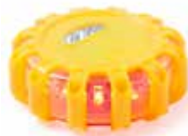
Ref. 5693 Luz de emergencia de 15 ledes con superficie magnética y 15 posiciones de iluminación. Con accesorio de ajuste. Alimentación a pilas: 3xAAA no incluidas. Área máxima de impresión: 40 x 5 mm