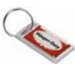
Ref. DT2152AG Llavero de Aluminio rectangular personalizado con doming. Medida: 45x25 mm. Colores: ○

LLAVEROS (Ejemplos de llaveros, consultar otros modelos y disponibilidad)