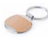
Ref. DT5796MKCIR Llavero metal y madera natural personalizado con láser. Medida: Ø 32 mm. Colores: ○