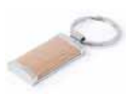
Ref. DT5796MKREC Llavero metal y madera natural personalizado con láser. Medida: 22x60x7 mm. Colores: ○