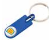
Ref. DT4443MK Llavero metálico de varios colores personalizado con doming. Medida: 2x55x5 mm. Colores: ●●●●●●●●