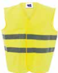
Ref. 8025 Chaleco reflectante de alta visibilidad, homologado según normativas de seguridad CE. Con doble tira reflectante alrededor del cuerpo y cierres de velcro. Talla única para adulto. Homologado