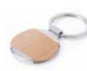
Ref. DT5796MKCIR Llavero metal y madera natural personalizado con láser. Medida: Ø 32 mm. Colores: