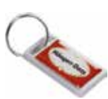
Ref. DT2152AG Llavero de Aluminio rectangular personalizado con doming. Medida: 45x25 mm. Colores: ○