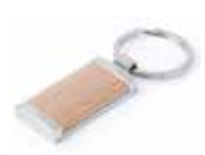
Ref. DT5796MKREC Llavero metal y madera natural personalizado con láser. Medida: 22x60x7 mm. Colores: