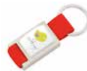
Ref. DT4442MK Llavero metálico y cinta de Poliéster, personalizado con doming. Medida: 27x60x6 mm. Colores: ●●●●●●