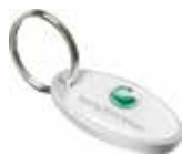
Ref. DT2154AG Llavero de Aluminio oval personalizado con doming. Medida: 44x22 mm. Colores: ○