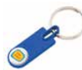
Ref. DT4443MK Llavero metálico de varios colores personalizado con doming. Medida: 2x55x5 mm. Colores: ●●●●●●